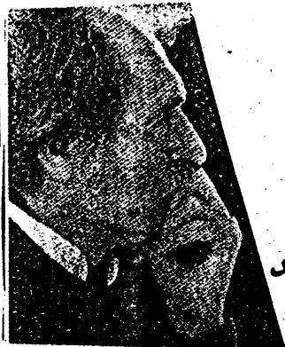
محمود دولت آبادی